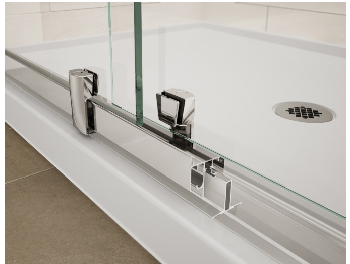
Adjustable Bottom Track bright chrome Rail du bas ajustable présenté en chrome brillant