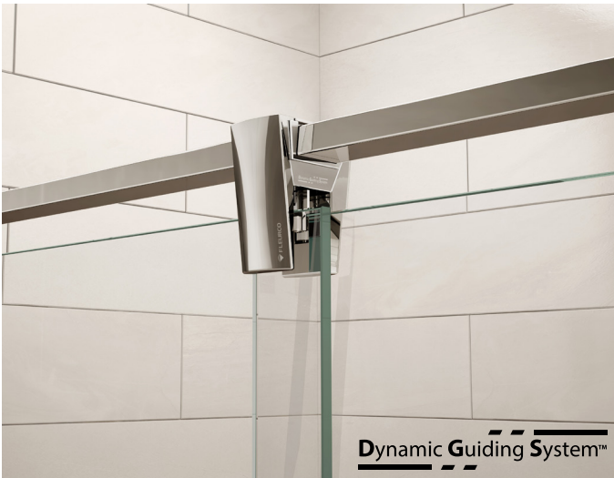
Dynamic Guiding System bright chrome Système de guide dynamique présenté en chrome brillant