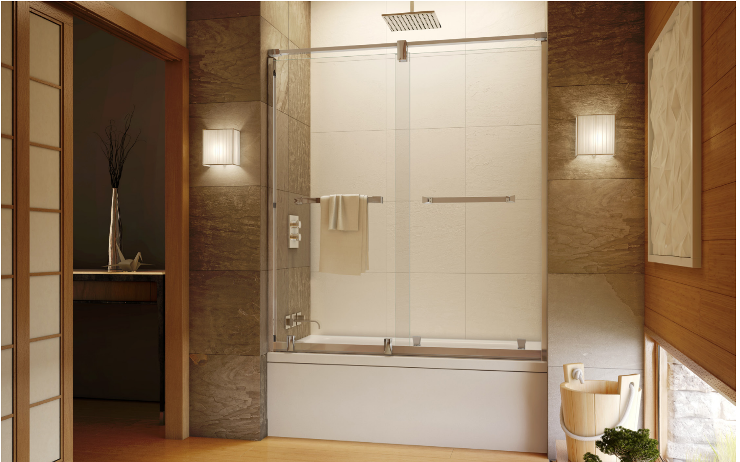
Model shown / Modèle présenté : Axent Tub / Axent en baignoire (LXT57-11-40)