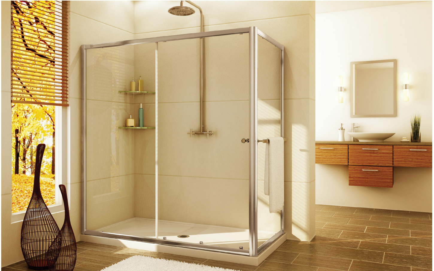
Model shown / Modèle présenté: EAL2-7236-11-40

Semi-frameless in-line sliding shower doors with return panel / Portes de douche coulissantes avec cadre partiel et panneau de côté