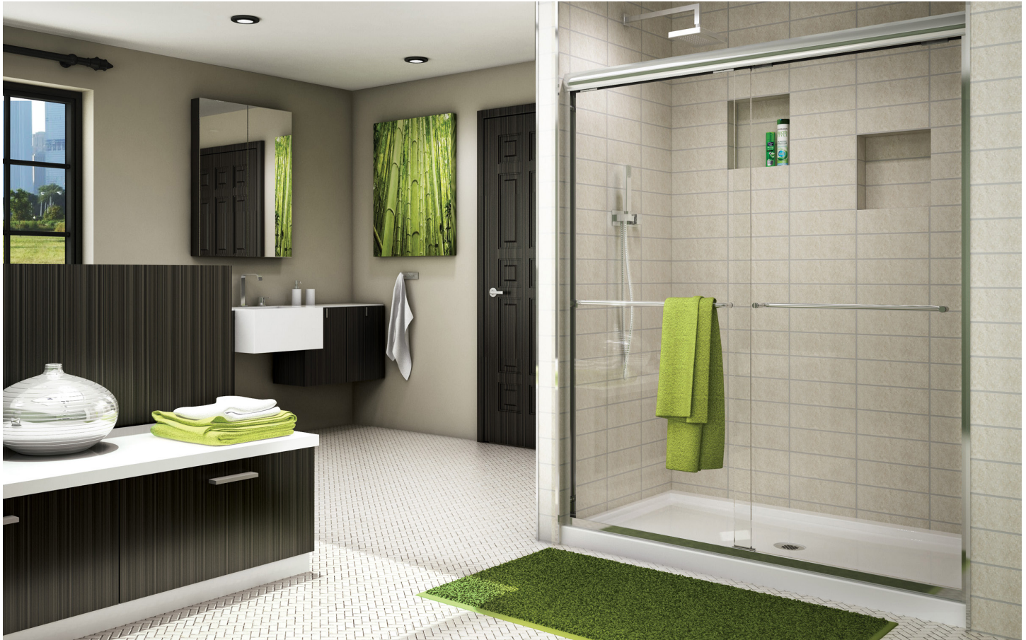
Model shown / Modèle présenté : Cordoba (E51060-11-40)