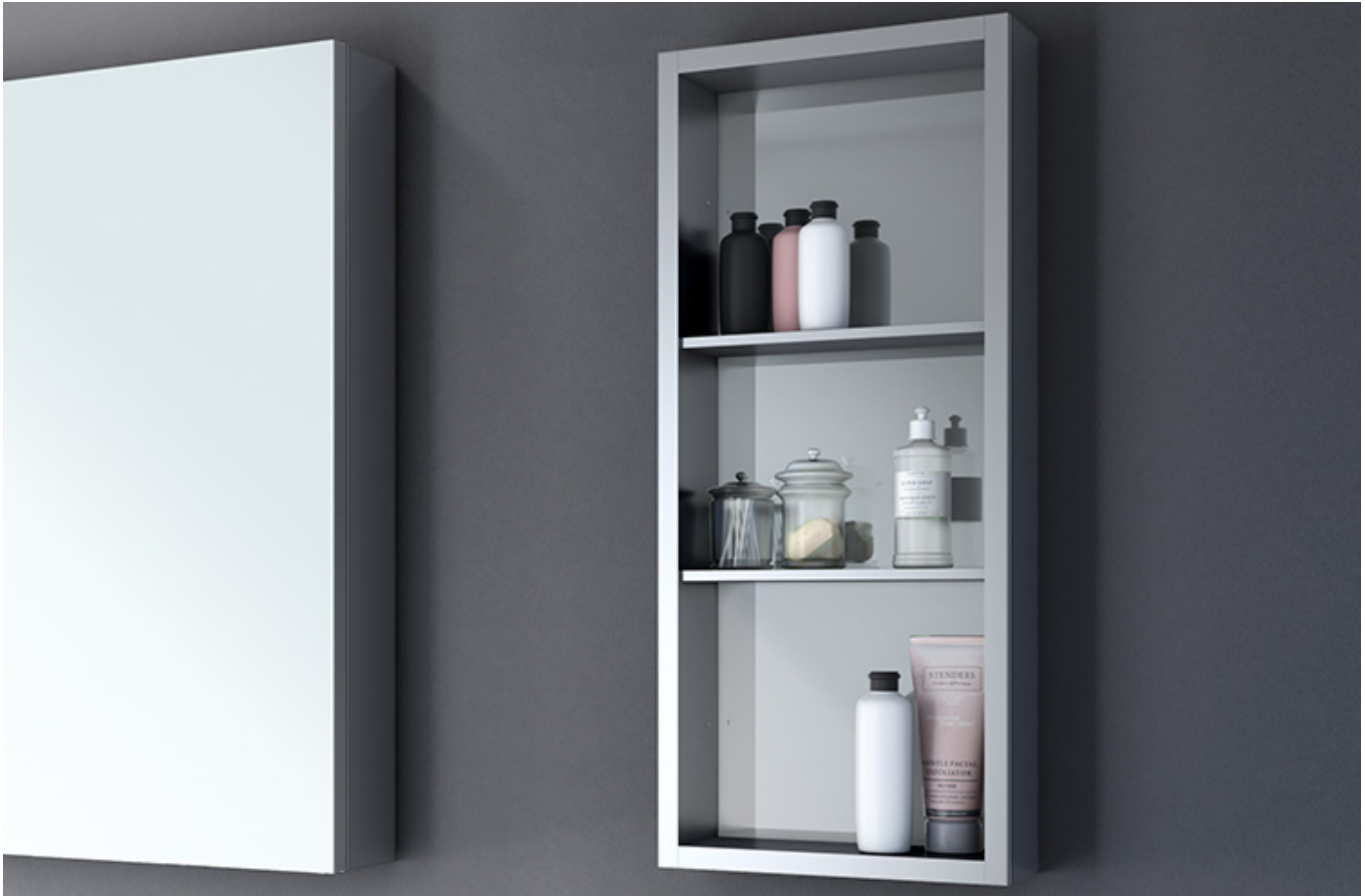
Model shown / Modèle présenté : MCND1230-11