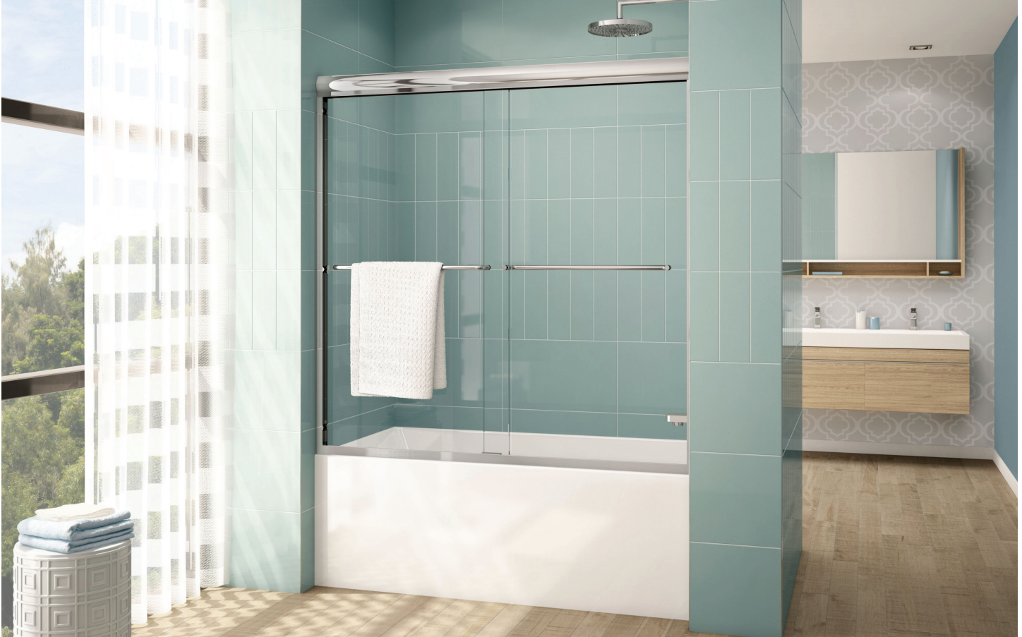
Model shown / Modèle présenté : CLTS60-11-40-A

Semi-frameless in-line sliding tub doors / Portes de baignoire coulissantes avec cadre partiel