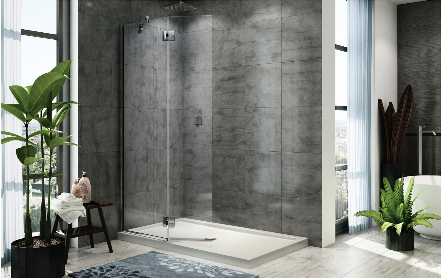
Model shown / Modèle présenté : VWXSS24-11-40L-M