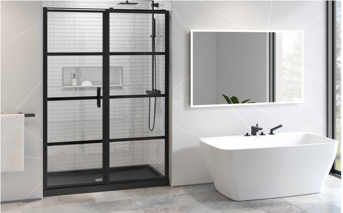
Model shown / Modèle présenté : LAP60-33-43-79

Pivoting Door with fixed panel / Porte Pivotante avec panneau fixe