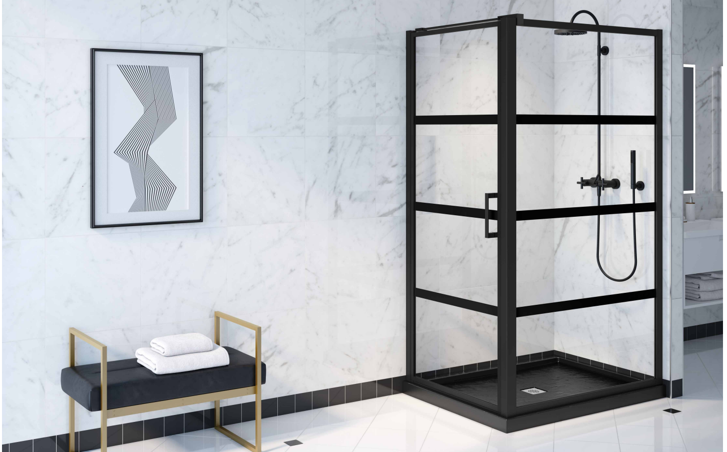
Model shown / Modèle présenté : LAPC3648-33-43-79

In & Out door with return panel / Porte Pivotante avec panneau retour